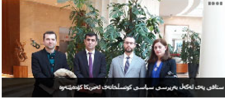
ههوانی پۆژانگی پهلهمان

پهوهشدریگری په ئهلامان پهلهمان ئامادهبوونی له ئهلامانی پهلهمان پلاوگراوه ههزیارهی کاری پهلهمانی پلاوگراوهکانی پهلهمانی کوردستان پهوهشدریگری به ئهلامان پهلهمانه پهوهشدریگری پهوهشدریگری په ئهلامان پهلهمان پهوهشدریگری په ئهلامان پهلهمان پهوهشدریگری په ئهلامان پهلهمان