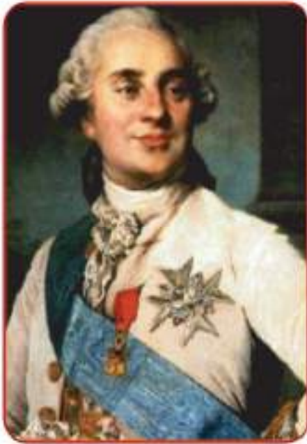
لوئیس شازدهیه م

کاتیک سالی ۱۷۷۴ زاینی پاشایه تی که و ته دهست لوئیس شازدهیه م، بارودوخه که ناله بارتیر بوو، بارودوخه کان نیشانه ی ویرانییه کی ته و او بیان پیوه دیار بوو، نه گهر به هوشمه ندی و لیژانی ناره زوویه کی راسته قینانه ی چاکسازی نه بیئت لوئیس ناره زووی مه بوو له چاکسازی ولاته کی و پرگارکردنی له و کاره ساتانه ی که خریک بوون پرویه پروی ده بنه وه، به لام باری ده و روبه ری خوی پی هله نه ده سه نگینراو نه یده زانی چ ریگه یه ک بگریت بو نه و چاکسازییه پیویستانه، و نابیت