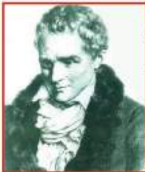
جان جاک رۆسو

ژان ژاک رۆسو به‌گه‌وره‌ترین نووسه‌ری سه‌رده‌می خۆی داده‌نریت که هه‌ست و نه‌ستی جه‌ماوه‌ری وروژاندوو، ئه‌وه‌ش یامه‌تی داوه‌ بۆ ئه‌وه‌ی ببیته‌ هێزێکی کاریگه‌ر له‌ رووداوه‌کانی سه‌رده‌می خۆی و دوا‌ی خۆیشی، چونکه له‌ راستیدا تیکۆشه‌ریک بووه‌ دژی گه‌لێک له‌ پوه‌تانه‌ی خه‌لکی به‌راست و پیرۆزیان زانیوه. کتێبه‌که‌ی (گرێبه‌ستی کۆمه‌لایه‌تی) یاخود (په‌یمانی