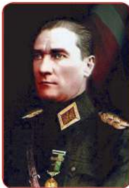
مسته فا که مال

کاتیک نه م نه جوومه نه گو یزیه وه بۆ نه نقه ره به لگه نامه ی نه جوومه نی گه وه ی نیشتمانی دانا، که بپروانه ی بزوتنه وه ی نیشتمانی بوو، نه م به لگه نامه یه ناشکرای کرد که هه موو نه و ناوچانه ی که تورک زۆریه ن به کیتیه ک پیکده هینیت که دابه شبوونی بۆ نییه و ده وله تیکی سه ره خۆیی ته واوی لی پیکدیت کاتیک وه زاره تی داماد فرید پاشای له ۵ ی نیسانی سالی ۱۹۲۰ ز پیکهات که دوزمنی سه ر سه ختی بزوتنه وه ی که مالییه کان بوو، مسته فا که مال ناشکرای کرد که په یوه ندی له گه ل حکومتی نهسته نبۆل بپسوه و له نه نقه ره له حکومت جیا بۆته وه.