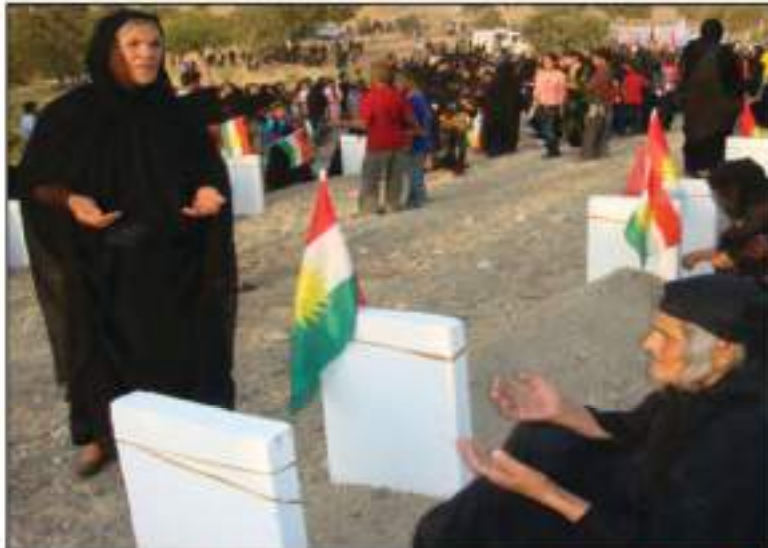
دایگان له سهر گۆری که سوکاریان، له دواى هینانه وه یان له بیابانی یوسه یه ی موسه نا

له م په لامارانہ ی گرتن و راوه دونان، نزیکه ی (۸۰۰۰) ههشت ههزار نترینه ی بارزانی له گنج و پیر به ساغ و نه خوښه وه، ته نانه ت نه وانہ ی که له روی دهر ونیشه وه ته واو نه بوون ده سگری کران و شونبز کران و ژن و منداله کانیشیان به بی سهر پهرشتی و به ژیانیکی مهرگه ساتی له نوردوگاگان هیشته وه. به پیی به لگه نامه کان، نه و پیاوه بارزانیانہ ی ته مه نیان له ۱۵ سال به ره و سهر وه بوو بو به غدا گواسترانه وه و ره وانہ ی دادگای به ناو شوړش کران، له م دادگایه به شیوه یه کی ره مه کی حوکمی له سیداره دانیان به سهر دا سه پانندن، دواتر حوکمه که جیبه جیکرا. هر چه نده نه و تومه تانه ی که ناراسته ی نه و که سانه کرابوو بیینه ماو نادروست بوون، به لام به دادگایه کی روکه شانه سزای مهرگیان به سهر سه پیندرا، هه ندیکیشیان پاش گرتنیان گواسترانه وه بوو خواروی عیراق، ره وانہ ی پاریزگای موسه نا (سه ماوه) کران، له نوردوگاگانی (نه بوجد و نه لیه) دا ده سبه سهر کران. نه م شوینه (۴۵) کم له سنووری سعودیه دووره، ناوچه یه کی بیابانی لماوییه.