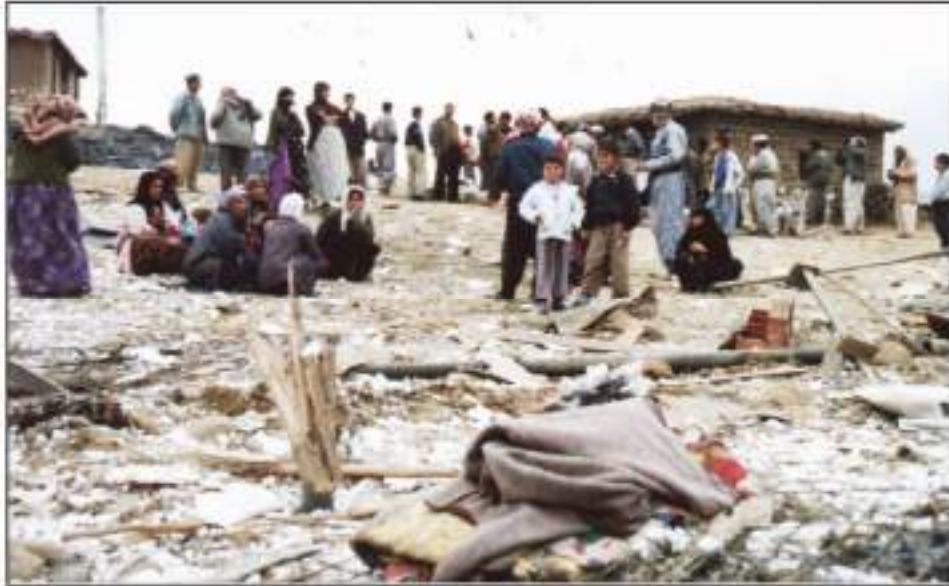
خۆ ناماده کردن بۆ کۆچ له دواى ئەنفال

سەرجه می گونده وێرانکراوهکانی شالاری ئەنفالی کۆتایی بە پیتی زانیارهکان (٤٥٠) چوار سەد و پەنجا گوند بوو. زیانه گیانیەکانی ئەنفالی بادینان بە نزیکەی سی و دوو هەزار کەس دەخەملینریت، گولەباران و شونبزرکران، زیاتر لە سەد هەزار کەسیش ئاوارەو دەری دەهەری تورکیا و ئێران بوون، ئەوانی تریش گواستراوه بۆ کۆمه‌لگاکانی جەژنیکان له نزیک هەولیر.