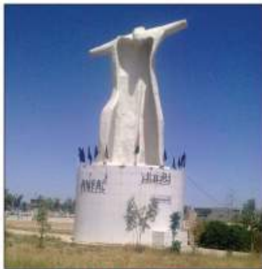
مۆنۆمێنتی نه‌نفال له‌ گهرمیان

له‌ نه‌نفالی قهره‌داغ ئه‌و هاوولاتیبه‌ کوردانه‌ی که‌ گیران یا خۆیان دا به‌ده‌سته‌وه، بۆ سه‌ریازگه‌ی قۆره‌توویان گواستنه‌وه، که‌ نزیکه‌ی هه‌شت هه‌زار که‌س ده‌بوون له‌ ژن و مندال و پیر و گهنج، پاشان گواسترانه‌وه بۆ سه‌ریازگه‌ی تۆبزاوه‌ نزیك که‌رکوک. ئینجا له‌وی گهنجه‌کانیان له‌وانی تر جیاکرده‌وه و به‌ره و شوینی نادیار ره‌وانه‌کران، خه‌لکه‌که‌ی تر له‌ ژن و مندال و کچی عازهب‌خرانه‌ زیندانه‌وه به‌لام پیره‌ژن و پیره‌میره‌کان بۆ (نوگره‌سه‌لمان)ی بیابانی سه‌ماوه‌ گواسترانه‌وه، که‌ له‌وی ژماره‌یه‌کی به‌کجار زۆریان له‌ برسان و تینویه‌تی و نه‌خۆشی مردن و ته‌رمه‌کانیان فریده‌درایه‌ ده‌ره‌وه‌ی زیندانه‌که، سه‌گ ده‌بخواردن.