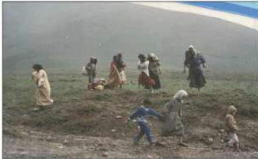
دەركردنى كورد لە زىدى باب و باپىرانيان

دواى ريكەوتىنامەى جەزائىر سالى (١٩٧٥) و ھەرەسھىتانی شۆرشى ئەيلول، دەستى حكومەتى عىراق كراوھبوو، بۆ جىبەجىكردى زياترى سياسەتى بەعەرەبكردى و راگواستنى كورد، بەلام ئەمجارەيان بەپىي نەخشەيەكى پلان بۆدارپىژراو ئەنجامدرا، نەك لەو ناوچانەى كە فرە نەتەوھبوون، بەلكو ئەمجارەيان ناوچە زۆرىنە كوردىيەكانىشى گرتەوھ. بە راگوپىزرايان بۆ كۆمەلەك شويىنى ديارىكراو، كە بەعسىەكان ناويان نابوو (گوندى ھاوچەرخ)، كەچى لە راستىدا ئۆردوگاي زۆرەملى بوون. بىجگە لەم ژمارە زۆرەى ھاوولايىانى كورد، كە بۆ ناوچەكانى باشوورى عىراق، بەتايبەتى ھەردوو شارى (ناسرىە و ديوانىە)، سالى (١٩٧٥) زياتر لە (٢٠٠٠٠٠) دووسەد ھەزار كورد لە كوردستانەوھ بەرھو ناوچەكانى باشوورى عىراق راگوپىزان. لە مانگى يازدەى ١٩٧٥ كۆمەلەى گەلانى ھەرەشەلىكراو لە نەلمانيا - گوپتنگن، لەگەل كۆمەلەى مافى مەروۇف لە ھۆلەندا، رايانگەياندا ژمارەى راگوپىزراوان