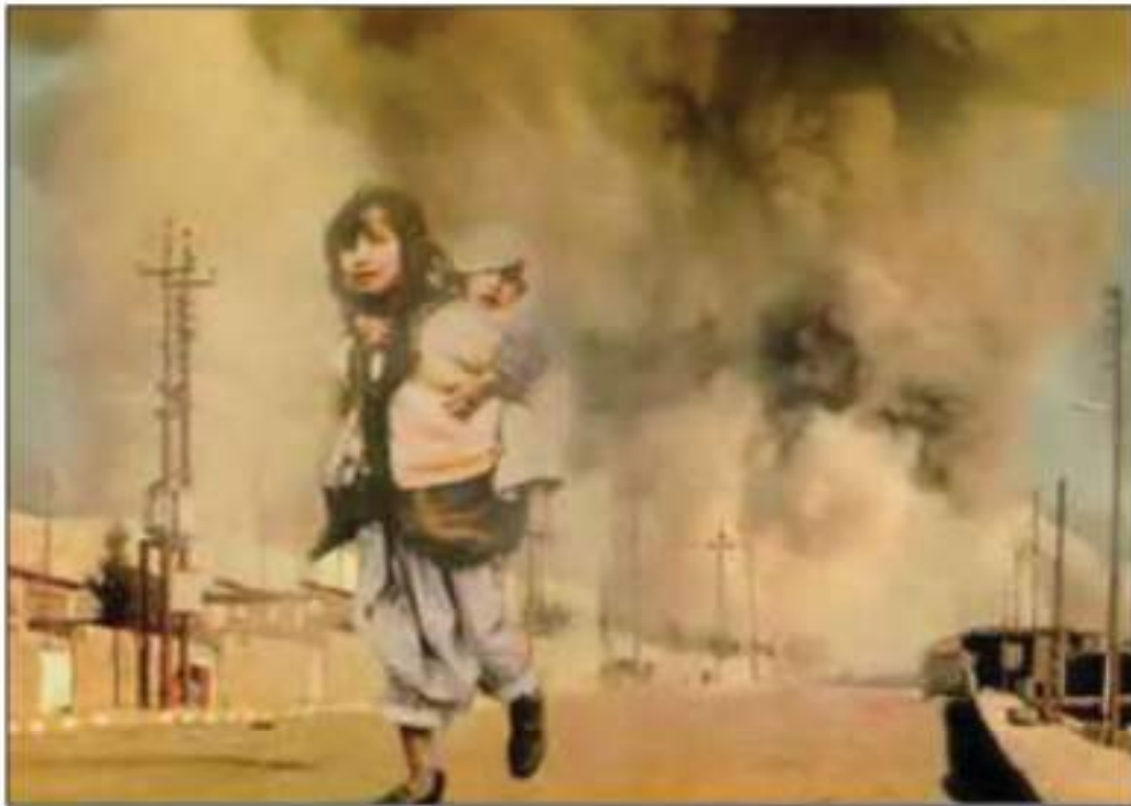
( ۱۶ ئاداری ۱۹۸۸ ) له کاتی بوردمانکردنی هه له بچه

رهوبکه ن، به لام فرۆکه کانی رژیم به رده وام به سه ر ناوچه که دا ده سورانه وه و دهره تیان نه دا خه لکه که خویان رزگار بکه ن.