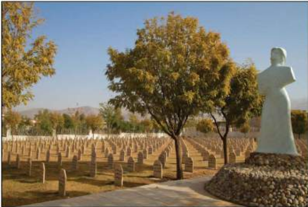
گۆرى بەكۆمەلى قوربانىانى كىمىيارانى ھەلەبجە

مادەى ھەشت: ھەر لايەنىكى رىكەوتنامەكە بۆى ھەيە داوا لە دامەزراوہ تايبەتمەندەكانى نەتەوہ يەكگرتووہكان بكات، كە بەپىي پەيماننامەى نەتەوہ يەكگرتووہكان ھەر رىوشونىكى گونجاو بگريتەبەر بۆ قەدەغەكردن و سەركوتكردنى تاوانەكانى جىنۇسايد ياخود ھەر تاوانىك لە تاوانەكانى مادەى سىيى رىكەوتنامەكە.