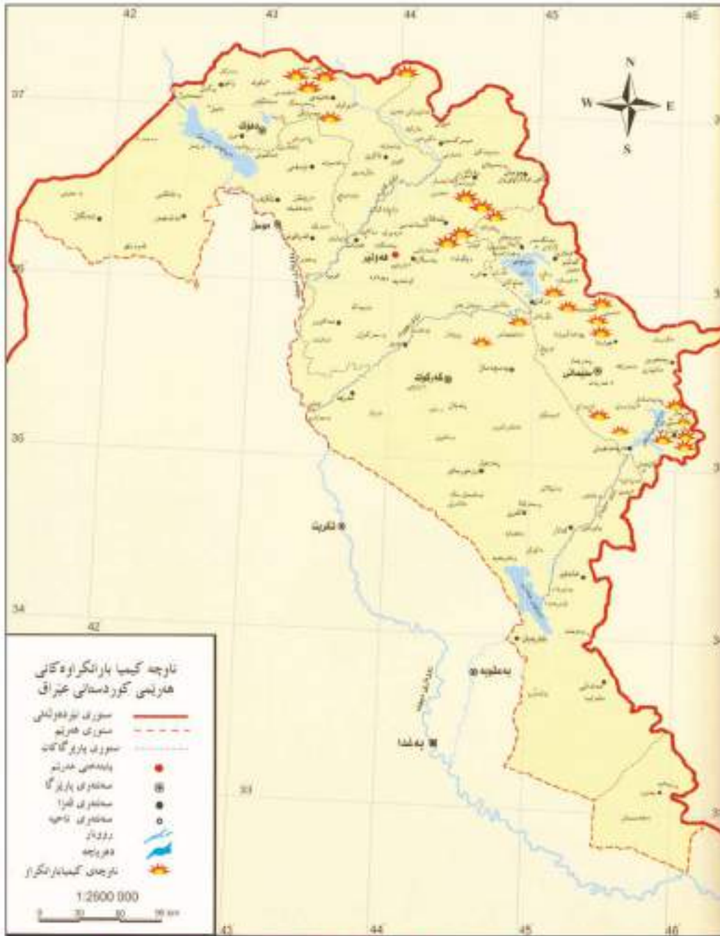
نەخشەی ژماره (٤) ناوچه کیمیا بارانکراوهه کانی هریمی کوردستان *