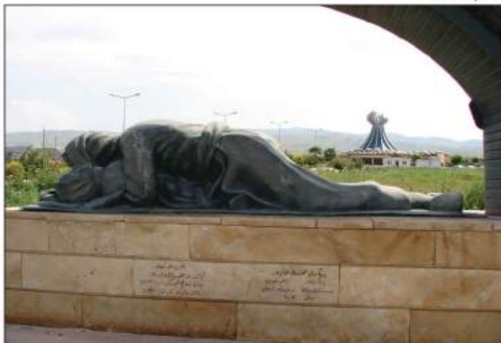
په یکه ری عومهری خاوه ر و مۆنۆمێنتی شه هیدانی هه له بجه

رۆژ به رۆژ به کاهینانی ئەم چەكە ترسناكه تا دههات له زيادبوون دابوو، له قوناغه كانی ئەنفال گهيشته لوتكه ی به كارهینان، رژیم به بی سله مینه وه هه ر به رگریه كهك یا كۆسپێك له شوینێك بهاتا بایه پیش سوپای رژیم به چه کی کیمیاوی چاره سه ریان ده کرد. هۆیه کهشی بو بیدهنگی کۆمه لگی نێوده ولته تی و بیکه سی که لی کوردو گۆشه گیری له ناوچه یه کی دابرا وادا ده گه ریته وه .