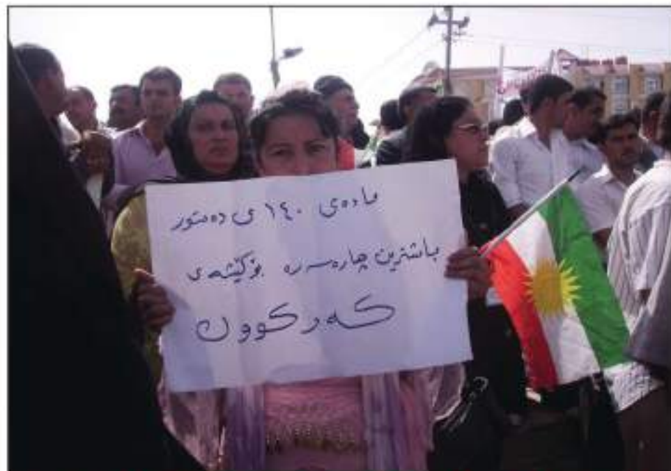
داواکاری ناوچه دابری نراوه کان به جیبه جیکردنی ماده ی ( ۱۴۰ ) ی دهستوری نوی عیراق

هه رچه نده له دوا ی روخانی رژیمی به عسه وه چاره نویسی ناوچه دابری نراوه کان به ستراره ته وه به ماده ی ( ۱۴۰ ) ی دهستوری نوی عیراق، که به پیتی نه م ماده به ده بویه تا کوتایی سالی ( ۲۰۰۷ ) کیشی پاکتاوی ره گزی له م ناوچانه دا چاره سه ر بکرا بایه و چاره نویسیان دیار بکرا بایه، که ده چنه سه ر سنووری حکومه تی هه رژیمی کوردستان یا له گه ل دهسه لاتی ناوه ند ده مینه وه، به لام تا کو نیستا جیبه جینه کراوه و نه و به نده دهستوریانه ش مسوگه ر نین له به رده م هیزه توند ره وه عه ره بیه کاندای تا کو به رجه سته بییت.