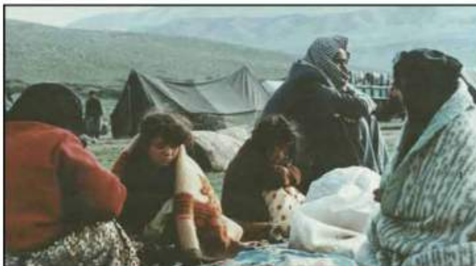
کوردە فەیلییەکان لە خێوەتگاکانی سەر سنووری ئێران

لە سالی ١٩٢٤ یاسای رەگەزنامەي عێراقی جەختی لەسەر دابەشکردنی گەلی عێراق کردەو بەو سێ بەش لەسەر بنەمای ئایین و نەتەو. کوردە فەیلییەکان لەبەر ئەوەي لە پەیرهوانی رێبازی شیعە مەزەب بوون، بە رەجەلەکی ئێرانی ناوئوسکران، بۆیە بە بەردەوامی کەوتنە بەر هێرشێ دەسەلاتدارانی عێراق.