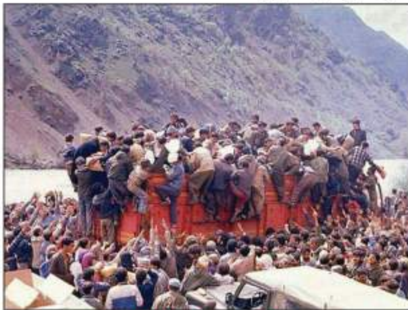
له کۆڕەوی سالی ۱۹۹۱ دا

لەمیانه ی بابەتەکانمان دەردەکەوێت کە ئەو رژێمانە ی کوردستانیان بەسەر دابەشکراو، هەمان سیاسەتی پاکتاوکردنی رەگەزیان دژ بە گەلی کورد پەیرەو کردوو. چەندین شیوازیان بەکارهیناوه بۆ سڕینەرە ی نەتەرە ی کورد، بۆیە بەردەرەوام لە دژایەتی کردنی کورد هاوکار و هاوڕا بوونه و پەیمان و بەلئینیان لەنیوان خۆیاندا بەستوو. هەر یەك لە ولاتانە ی ئەو بەشە ی کوردستانیان بەرکەوتوو، بەهیچ جۆرنک بە خاکی کوردی نازننیت و دانیش بە مافەکانی گەلی کورد نانی.