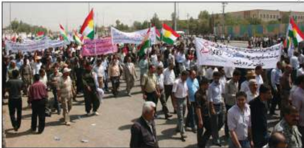
خۆپیشاندانی توێژهکانی کهرکوک له دژی په پیره وکردنی سیاسهتی صدام له تۆقاندن و ده رکردنی دانیشتوانه که ی

قۆناغی دوای روخانی رژیمی به عس له ناوچه دابریئراوهکان، له سالی (۲۰۰۳ تاكو ئیستا)، که کیشهیهکی زۆری له سه ره، له نیوان کورد و دهسه لاتی ناوهندی له بهغدا له لایهک، دانیشتوانی کوردو گروپه تیرۆرستهکان له لایهکی تر، که هه ره شه له گیان و سامانی هاوولاتیانی کوردنشینی ناوچهکانی (سه عدییه و جهلهولا و قه ره ته په و شهنگال و رۆژئاوای کهرکوک ده کهن، بۆ به زۆر ده ره پارانندیان له شوینه کانیان بۆ ناوچهکانی ژێر دهسه لاتی حکومهتی هه ریمی کوردستان. هه ر چه نده حکومهتی ئیستای عیراق به ناشکرا په پرهوی بهردهوامبوونی سیاسهتی به عه ره بکردن و راگواستن ناکات، به لام بیدهنگ بوون و دهسته وهستانی له به رامبه ر گروپه تیرۆسته نه ژاد په رسته کان له پاراستنی گیان و سامانی هاوولاتیانی کورد و هه لپه ساردنی مادهی (۱۴۰) ی ده ستور. هۆیه که بۆ بهردهوامبوونی سیاسهتی به عه ره بکردن و راگواستن و پاکتاوی نه ژادی گه لی کورد له ناوچه دابریئراوهکان.