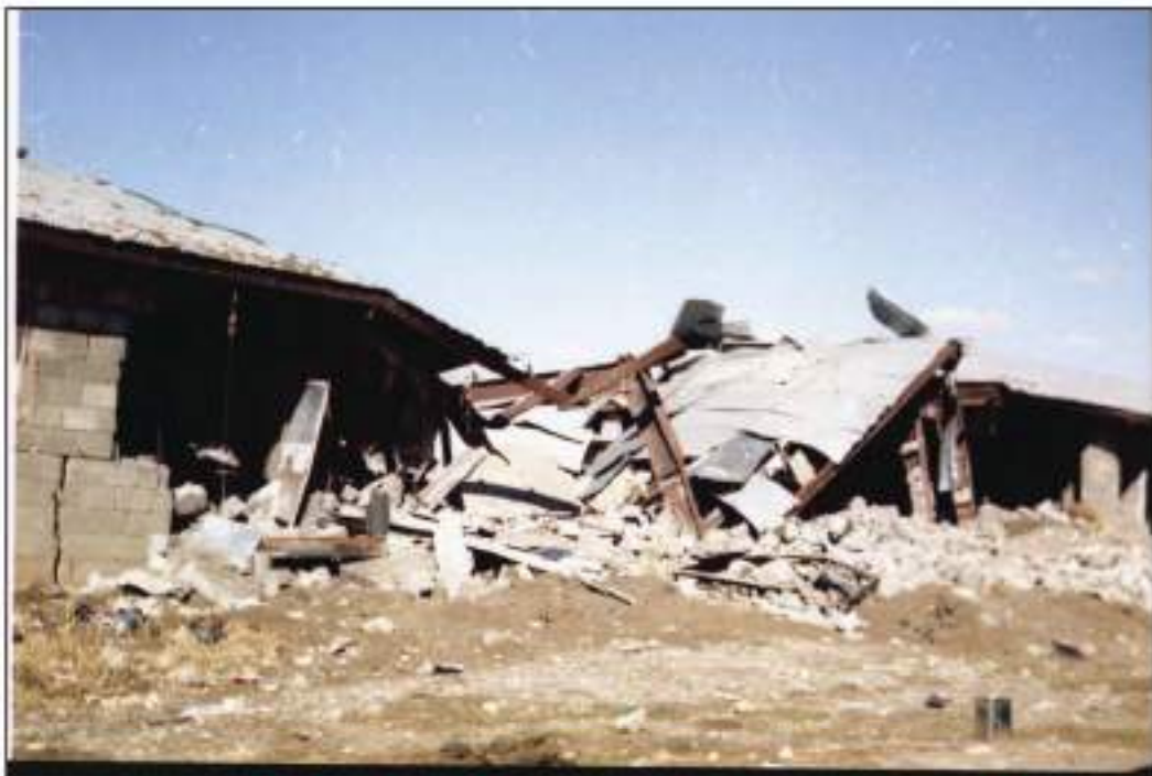
شۆپتەوارى بۆردومانى ئۆردوگای زێوہ لەلايەن فرۆكە جەنگپەكانى عىراق

بەسەرە) راگوپیزران، بۆ چەند سالتىك لەوى مانەو، پاشان خىزانەكانيان بەسەر گوندەكانى دەۆك و ھەولتەر دابەشكران. لەدواى رىكەوتننامەى جەزائىر، كە لە نىوان شای ئىيران و حكومەتى عىراق لەسالى ۱۹۷۵ لە دژى بزوتنەوہى گەلى كورد مۆركرا، بوو ھۆى شكستپيھتەنانى بزوتنەوہكە. حكومەتى عىراق ئەم ھەلەى قۆستەوہ و كەوتە گيانى گەلى كورد بەگشتى، بارزانىيەكانىش بەشيك بوون، كەوتنە بەر ئەم شالۆھ نامرۆفانەيە. لەدواى سالى ۱۹۷۵ پروسەى راگواستن فراوانتر كرا، ھەندىكيان بەرھو ئىيران رۆيشتن و ھەندىكيشيان گەرانەوہ ناو كوردستان.