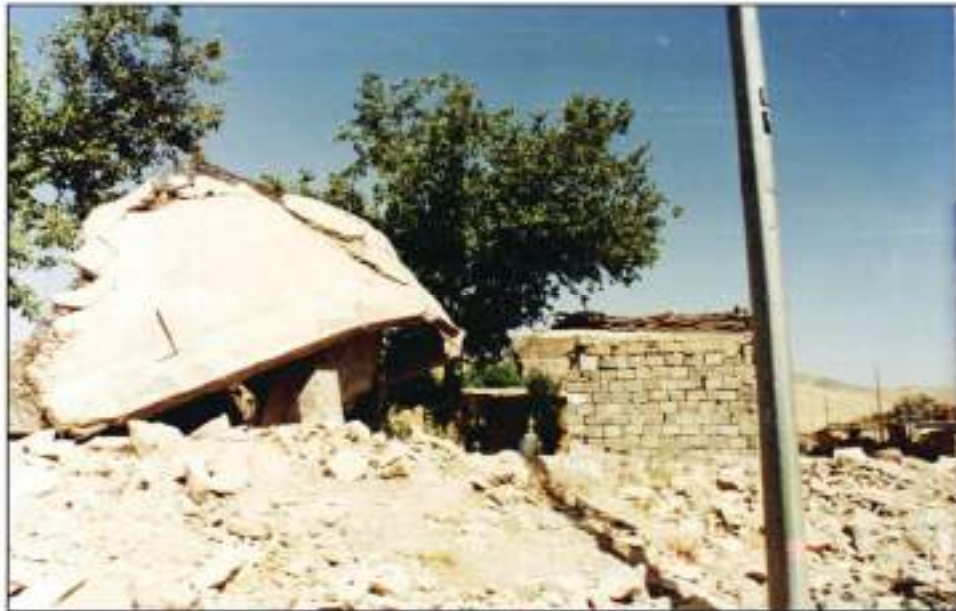
ویترانکردنی گوندەکانی کوردستان له کاتی ئەنفال

به لام گیراوه‌کانی باشووری گه‌رمیان له دوو مه‌لبه‌ندی سه‌ره‌کی کۆکرانه‌وه، یه‌کیکیان مه‌لبه‌ندی لاوانی دوزخورماتو بوو، که نزیکه‌ی چوار هه‌زار که‌سی تێدا به‌ندکرا بوو، سه‌ربازه‌کانیش زۆر نامرۆخانه‌هه‌لسوک و تیان له‌گه‌ل ده‌کردن، سه‌ره‌رای ئەشکه‌نجه‌دان و برسیکردن و تینوکردن، هه‌رچی پاره و زێڕو شتی به‌ترخیان پێبوو له‌ ئافره‌ته‌کانیان ده‌ستاند، پێیان ده‌وتن ئێوه یارمه‌تی (موخه‌ریبتان) داوه (پێشمه‌رگه). به‌لام مه‌لبه‌ندی دووهم بۆ کۆکردنه‌وه‌ی گیراوه‌کان، باره‌گای فیرقه‌ی (٢١) بوو له‌ قۆره‌توو. له‌ زاری یه‌کیک له‌ ده‌ربازیوه‌کانه‌وه‌ هاتوو، که نزیکه‌ی ده‌ هه‌زار که‌س له‌م قه‌لا سه‌ربازییه‌ به‌ندکرا بوون.