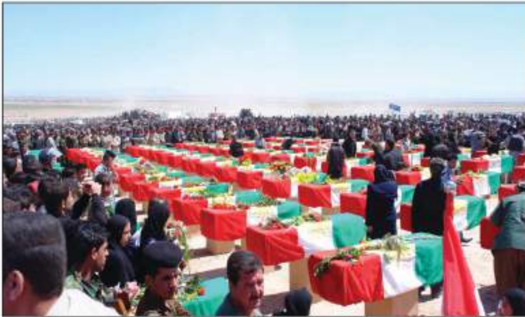
رێبۆرەسمی دووبارە ناشتنەوێ ئەنفالکراوانی گەرمیان

ئەنفال بەرچاوترین تاوانە لە دواى شەڕى دووھەمى جیھانیەو بە سەرگەلى کورد داھاتوو، بۆ لەناوبردن و سەرکووتکردنى بزوتنەوێ نەتەوێى کورد و سڤینەوێ ھەموو مۆرکى نەتەوێى و کولتورى و مێژوویى و دیمۆکرافى و کۆمەلایەتى و ئابوورى...ھتد.