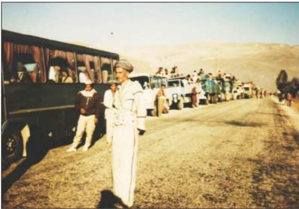
له دواى شهفالى بهرهم و ئيران رتده کەن

گوندیکی تر). له بهر به یانی ۲۵ ناب فرۆکه جه نگییه کان کیمیا بارانی گونده کانی برجینی ناحیه ی زاوخته و نه و بهری زتی خابور و هیسی و خه رابیا و یه کماله ی بهرواری ژیری کیمیا بارانکرد. نه گهر بهراوردیک له نیوان چری بوردومانه که و ژماره ی قوربانیان بکه یین، بۆمان دهرده که ویت کاریگری کیمیا بارانه که که متره، هویه که ش بق نه وه ده که پتته وه، که پیشمه رکه توانیان پیشتر ناموزگاری و رینمایي خو پاراستن بلا و بکه نه وه، به لام مه پرو مالات و نازه لی گونده کان قریان تیکه وت و کیلگه کانیش له بهرهم که وتن.