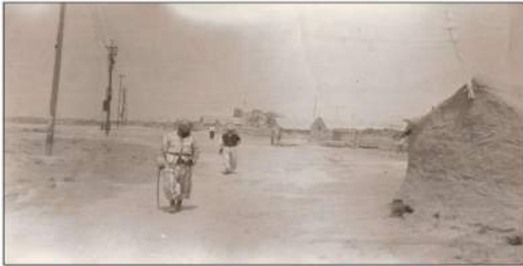
کۆمه‌لگه‌ی بارزانیه‌کان له قوشته‌په، دوور له پێداویستیه‌کانی ژبان

جێبه‌جێکردنی مه‌به‌سته‌کانیان، له به‌عه‌ره‌بکردن و تواندنه‌وه‌ی گه‌لی کورد، له قاوغی نه‌ته‌وه‌ی عه‌ره‌بیدا، بۆیه رۆژ به‌رۆژ هێرش و په‌لاماره‌کان توندتر ده‌بوونه‌وه و قوریانی زۆر ترو پێشیلکردنی مافه‌کانی مرۆفیش زیاتر ده‌بوون. بارزانییه‌کان له م هێرشانه پشکی شیریان به‌رکه‌وتوه، چه‌ندین جار له زیدی باب و باپیرانیان راگوێزران و تالانکران. هه‌ر له سه‌ره‌تای سییه‌کانی سه‌ده‌ی رابردوو که‌وتنه به‌ر په‌لاماری له‌شکری پیاده‌ی عێراق، به‌ پالپشتی فرۆکه‌ جه‌نگیه‌کانی ئینگلیز، چه‌ندین گوندیان وێرانکرد و دانیشتوانه‌که‌یان به‌ره‌و تورکیا رایانکردوه.