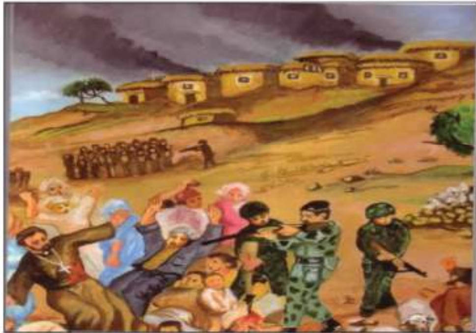
گوللەبارانکردنی (٦٠) کەس لە دانیشتوانی گوندی (سوریا)

لە ئەشکەوتیکی نزیک گوندە کە خۆیان حەشار دابوو. لە (١٦-٩-١٩٦٩) هێرش بۆ سەر گوندی (سوریا) لە سیڤگۆشەیی سنووری عێراق و تورکیا و سوریا، (٦٠) کەس لە دانیشتوانە سڤیلە کەیی گوللەباران کران. هەرچەندە مانگی ئاداری ١٩٧٠ رێکەوتننامەیی ئادار لە نیوان بزوتنەوەیی کورد و حکومەتی عێراق مۆرکرا، کە دانپێدان بوو بە مافی ئۆتۆنۆمی گەلی کورد لە هەریمی کوردستان. بەلام بەر لە راگەیانندی یاسای ئۆتۆنۆمی ژمارە (٣) سالی ١٩٧٤، حکومەت دەستیکرد بە جێبەجێکردنی بە پەلەیی سیاسەتی بەعەرەبکردن و راگواستنی دانیشتوانی ناوچەکانی کەرکوک و خانەقین و زمار و شەنگال و شیخان. لە سالی (١٩٧١ - ١٩٧٢) زیاتر لە (٤٠٠٠٠) چل هەزار کوردی فەیلی ناسنامەیی هاوولاتی بوونی عێراقییان