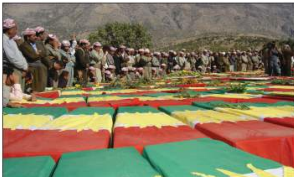
رپۆره سمی دووبار ناشتنه وهی زینده به چالکرا وه کانی بارزانی له گۆرستانی بارزان

له دوای روخانی رژیم له سالی ۲۰۰۲، له مانگی تشرینی یه که می ۲۰۰۵ به رپۆره سمیکی شایسته، ته رمی (۵۱۲) پینج سه د و سیزده کهس، که له گۆره به کۆمه له کانی بیابانی بوسه یه زینده به چالکرا بون، گه ریندرانه وه زیدی باب و باپیرانیان له نزیک بارزان دووباره به خاک سپیردرانه وه.