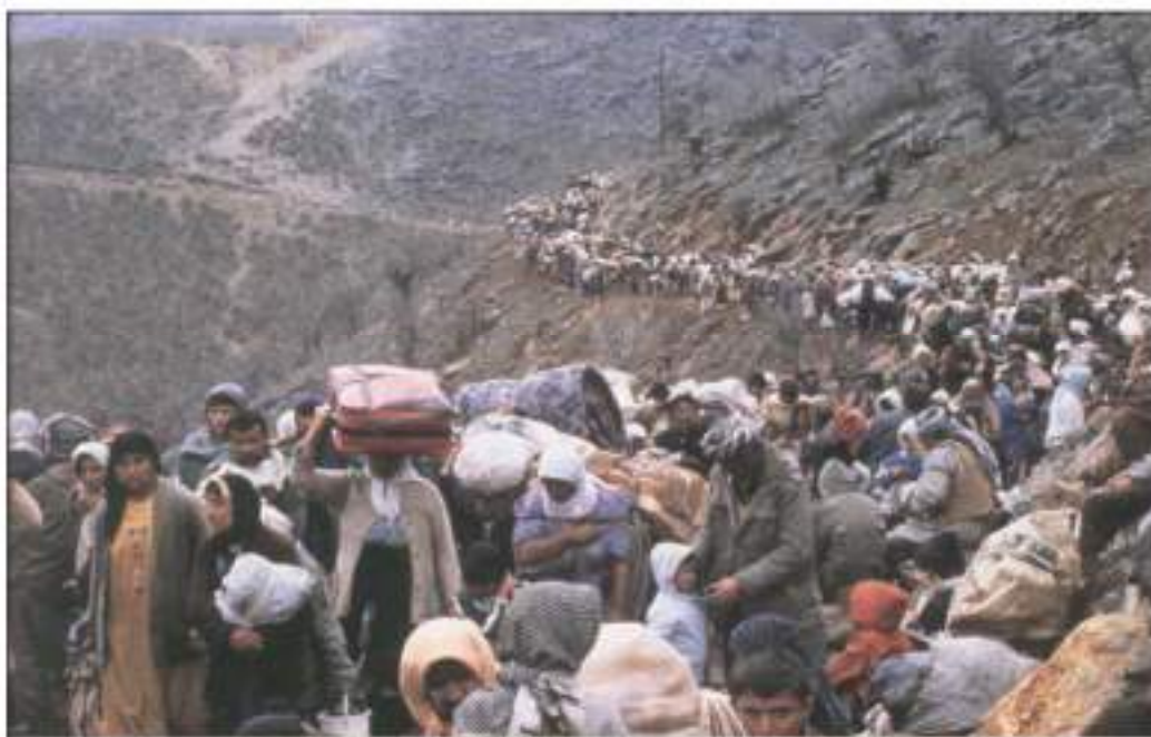
كۆرەۋى كوردان لە سالى ۱۹۹۱

كار بكات، چونكە ئەم راپەرىنە مېژوويىيە ھەموو ئەو ناوچانەشى گرتەو، كە بەعس دەیان سال بوو خەرىكى سېرنەو ھى مۆركە نەتەو ھىيە كوردىيە كانى بوو.