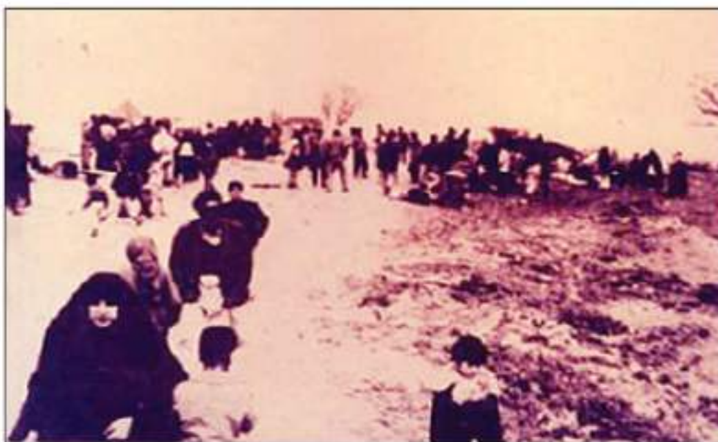
ده رکردنی کورده فه یلییه کان بۆ سنوره کانی نیران (ده روزه ی منزریه)

له نێوان (١٨ - ٢٨) سالدا بوو، وهك ده سه سه سه ره له لای رژیم مانه وه، نه وانی تریش به ره و سنوره کانی نیران دوورخرانه وه. بپیاره که جه ختی کرده وه هر که سیک بیه ویت بۆ عیراق بگه پیتته وه ده بی گولله باران بکریت. له میانای چه وساندنه وه و توندوتیژی، سه روکی پیشوی عیراق (صدام حسین)، داهینانیکى نوئی هینا کایه وه، نه و پیاوه ی عیراقییه و ژنه که ی فه یلییه ده بی لئی جیا بیتته وه، به رامبه ره به (٤٠٠٠) چوار هه زار دینار نه گه ره سه رباز بیت، (٢٥٠٠) دوو هه زار و پینج سه د دینار نه گه ره سفیل بیت.