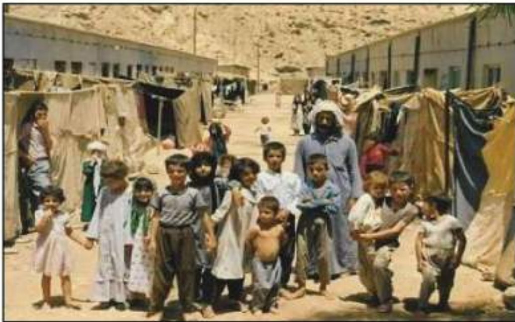
دەرکردنى پىر و مندالانى كورد و زىندە بەجالکردنى گەنجەكان لە گۆپرى بەكۆمەل

۲. جينۇسايدى بايەلۆزى: ئەم جۆرهيان برىتتايە لە رىگرتن لە وەچەنانەو و زۆربوون و گەشەسەندنى كۆمەلە مرقۇئىكى يەك رەگەز بەھۆى نەزۆك كردن و لەباربردنى ئافرەت و خەساندنى پىياوان و لىك جياكردنەوہى ژن و پىياو بۆ ماوہىەكى دريژ. ئەم تاوانانە لە شالاوہكانى ئەنقال لە سالى ۱۹۸۸ لە كوردستان پەپرەوكران، بەتاييەتى لە مەلەبەندەكانى كۆكردنەوہى ئەنقالكراوہكان لەكاتى جياكردنەوہى پىياوہكان لە ژنەكانيان، بەھەمان شيۆہ جياكردنەوہى نىرىنەى بارزانىيەكان لە خىزانەكانيان لە سالى ۱۹۸۲.