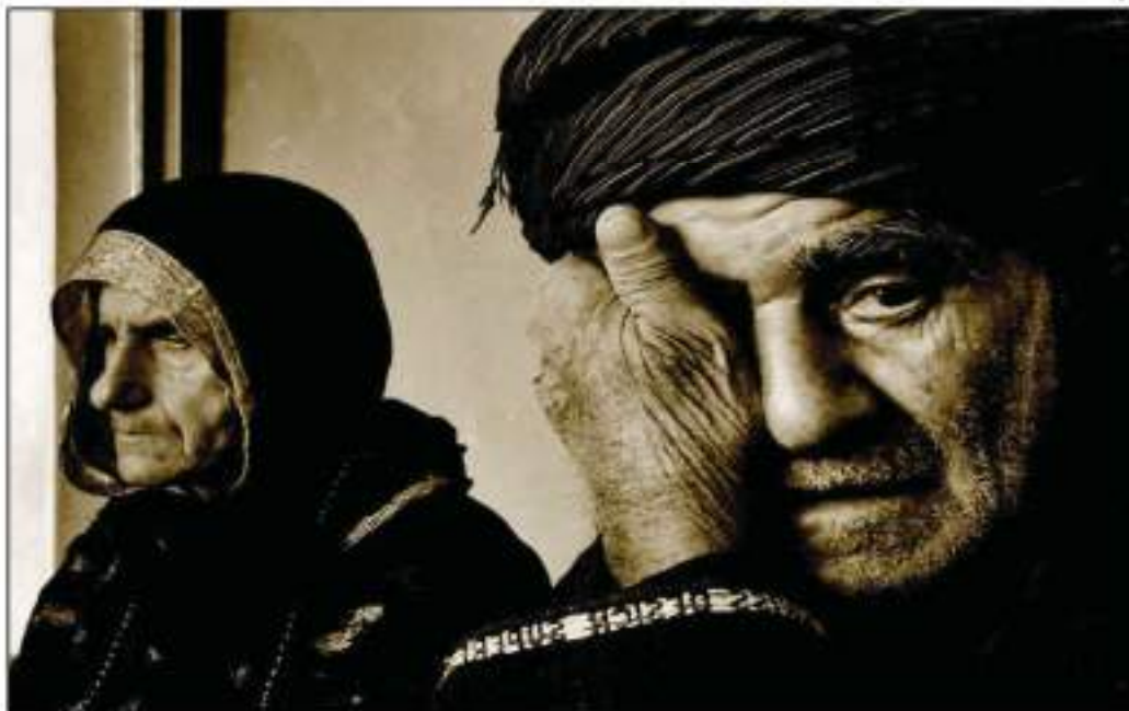
رزگار بووانی کیمیا بارانی هه‌له‌بجه

به ته‌واوه‌تی و کوشتنی هرچی په‌له‌وهر و مالاتی ناوچه‌که بوو هه‌مووی قهرکرد.