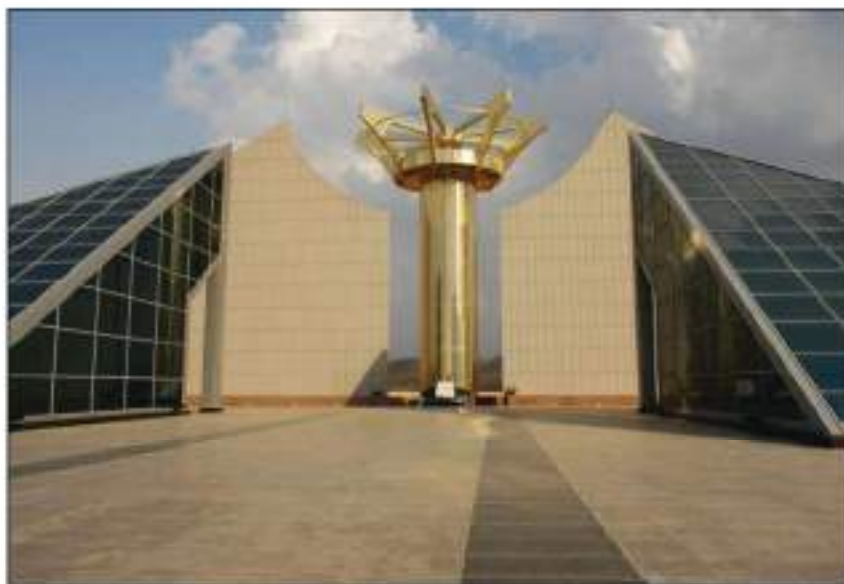
مۆنۆمېنتى شەھىد لە ھەولێر