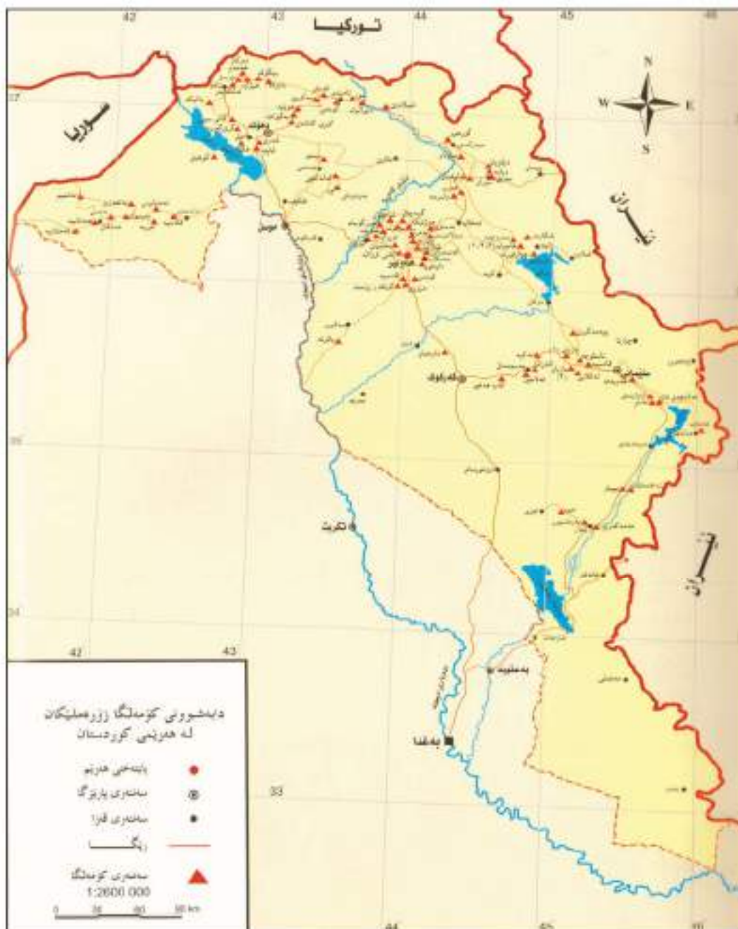
نەخشەی ژمارە (٣) دابهشورنی کومهلگا زۆرهملییهکان له ههریزی کوردستان*