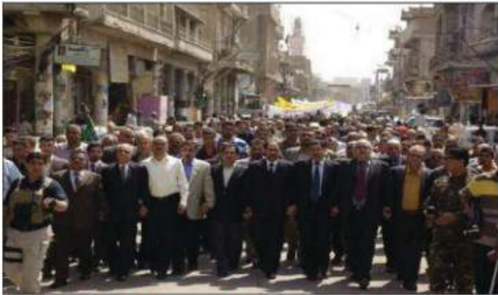
له‌یادی (٢٩) ساله‌ی راگواستنی کورده‌ فهیلییه‌کان رۆژی (٣/٤/٢٠٠٩) له‌ شه‌قامی کیفاح له‌ به‌غدا، بنکه‌ی کورده‌ فهیلییه‌کان

له میانه‌ی بهره‌وامبوونی سیاسه‌تی پاکتاوکردنی کورد، ته‌نیا له ٤ی نیسانی ١٩٨٠، (٥٠٠٠) پینج‌هه‌زار کوردی فهیلی به‌کۆمه‌ڵ له‌ ناو‌بردرا‌ن. به‌پیتی ئاماره‌کانی خاچی سوور و مانگی سووری نێوده‌وله‌تی (٤٠٠٠٠٠) چوار سه‌ده‌زار هاوولاتی فهیلی بوونه‌ قوربانی ئەم سیاسه‌ته‌ی رژێم به‌ کۆژرا و راگوێژراوه‌وه.