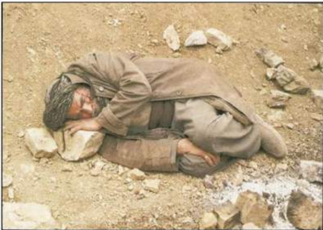
دادگای بالای تاوانه کانی عیراق کیشهی کورده فه یلییه کانی به جینۆساید ناساند

به لگه نامه ههیه که رهچه لهکی عیراکی خۆی بسه لمینی، ده بی له سه ر ژمیری ۱۹۵۷ ناونوس کرابیت، به لام خه لکیکی زۆر به لگه نامه کانیا نهماوه، له بهر نهوهی رژیم له کاتی شالۆه کانی ده رکردن و گرتنه کان هه مووی له ناوبردوه.