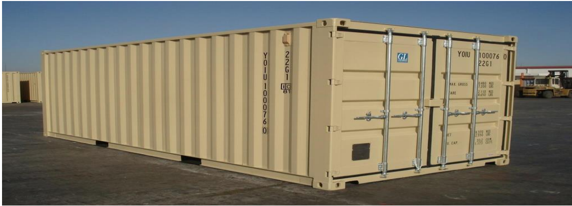
كۆنتيننهرى چەند دەرگا