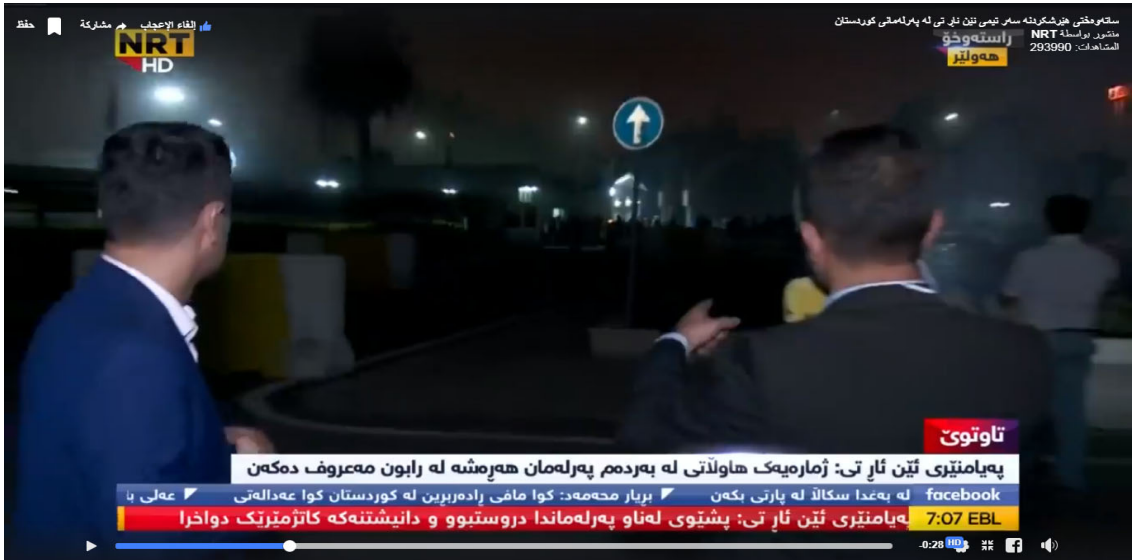
نیدوانی سه روکی نینستیوتی په یی پوراگه یاندنه گان نه ساتی په لاماردانی په رله مان شهوی ۲۹/۱۰/۲۰۱۷ نه په رله مان